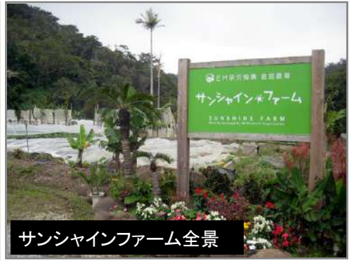
サンシャインファーム全景

して有名です。 客室は内装からリネン類、家具にいたるまで、すべてがEM処理されており、クリーンで心地よい空間になっているので、誰でもが癒された快適な気分になります。 食事は、安全・安心なEM食材を生かした健康料理で、