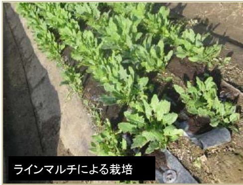
ラインマルチによる栽培

は収穫1週間以上前に行っています。 そうすることで、収穫前から次作の種を発芽させ成長させることが可能となるため、生産性の高い栽培が可能となります。 ◆EM・X GOLD新工場 昨年11月に完成したEM・X GOLDの新工場では1日に15000本も製造できる新工場は、大きく原料製造工