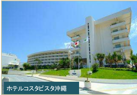
ホテルコスタビスタ沖縄

して有名です。 客室は内装からリネン類、家具にいたるまで、すべてがEM処理されており、クリーンで心地よい空間になっているので、誰でもが癒された快適な気分になります。 食事は、安全・安心なEM食材を生かした健康料理で、