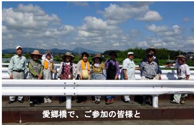
愛郷橋で、ご参加の皆様と