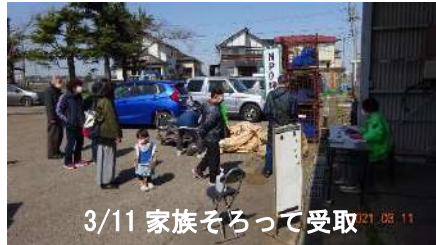
3/11 家族そろって受取