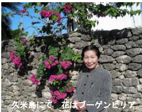
久米島にて 花はブーゲンビリア

第 21 回通常総会は昨年同様「書面議決」にて行い、第 1 号～4 号議案全て賛成多数で可決されました