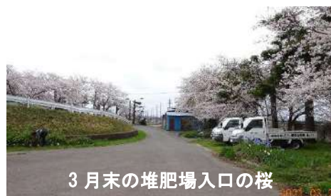
3 月末の堆肥場入口の桜

新型コロナウイルスの状況を見極めながら、それぞれの分野で、これまでの実績を踏まえ、会員の拡大及び活動の充実に努め、生ごみ堆肥化事業、水質浄化事業等の研究・検討を深め、さらに最新の EM 情報を収集し理解を深める。