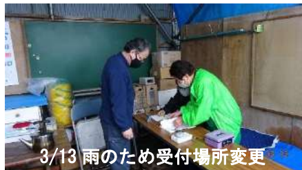
3/13 雨のため受付場所変更