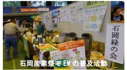
石岡産業祭で EM の普及活動