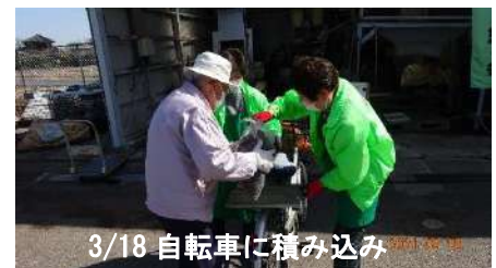
3/18 自転車に積み込み