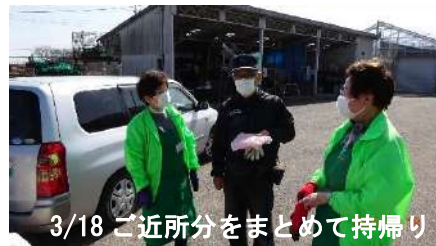
3/18 ご近所分をまとめて持帰り