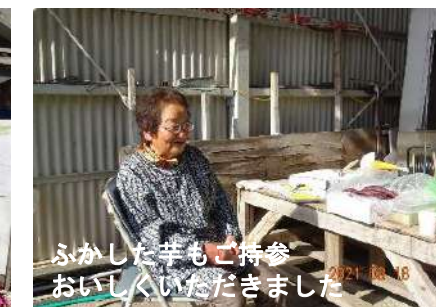
ふかした芋もご持参 おいしくいただきました