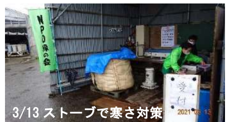
3/13 ストーブで寒さ対策