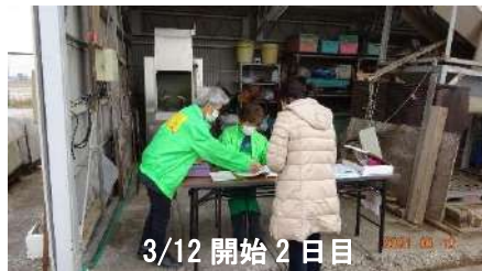
3/12 開始 2 日目